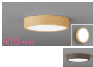
R15 クラス2 連続調光 高演色LED