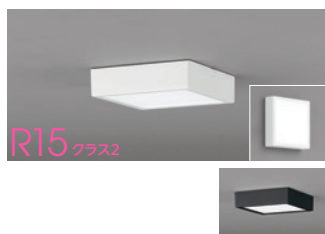
R15 クラス2 連続調光 高演色LED