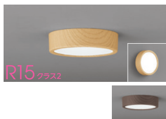
R15 クラス2 連続調光 高演色LED