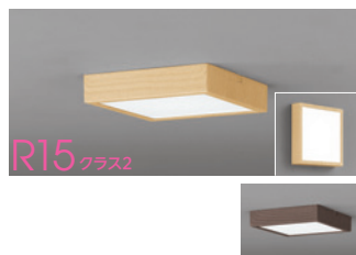
R15 クラス2 連続調光 高演色LED