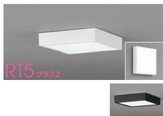
R15 クラス2 連続調光 高演色LED