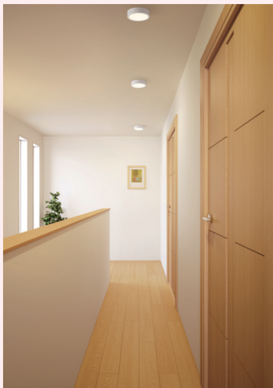
OL 251 777R