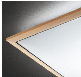
白木格のやさしい印象をウェンジ色の細木枠が引き締めた意匠。