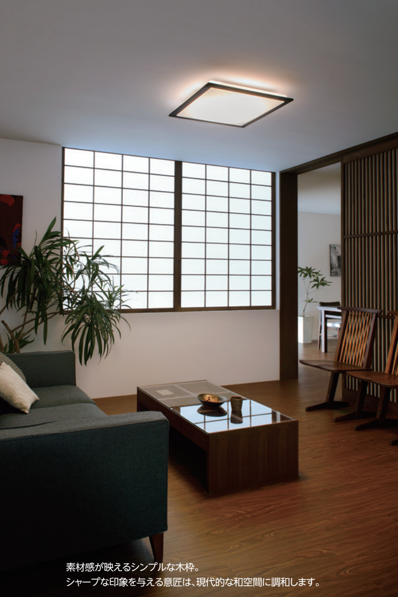
素材感が映えるシンプルな木枠。 シャープな印象を与える意匠は、現代的な和空間に調和します。