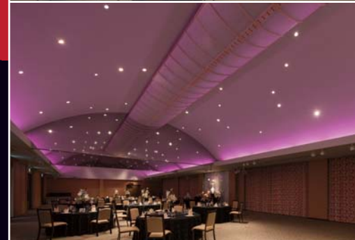
宴会宿泊施設 はぎ苑