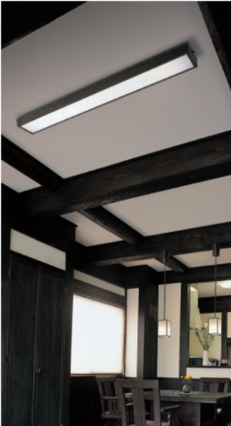
OL 291 872R2E/OP 252 386L 【実例番号 J16100_J01K】