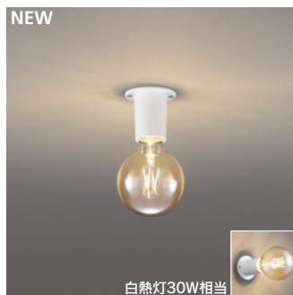
NEW OL 251 715LC1 [電球色] ¥8,800 (税抜き) [調光器別売]

適合調光器 → P.852-855-859 → P.856-861 別売 LC 211-212-213 LC 221-222-602-603-702 別売 LC 611-613 LC 615