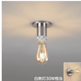
OL 291 116LC [電球色] ¥13,800 (税抜き) [調光器別売]

適合調光器 → P.852-855-859 → P.856-861 別売 LC 211-212-213 LC 221-222-602-603-702 別売 LC 611-613 LC 615