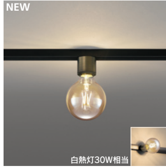
NEW OL 291 164LC [電球色] ¥9,800 (税抜き) [調光器別売]

適合調光器 → P.852-855-859 → P.856-861 別売 LC 211-212-213 LC 221-222-602-603-702 別売 LC 611-613 LC 615