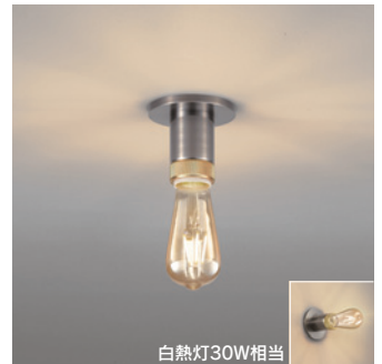
OL 291 117LC [電球色] ¥13,800 (税抜き) [調光器別売]

適合調光器 → P.852-855-859 → P.856-861 別売 LC 211-212-213 LC 221-222-602-603-702 別売 LC 611-613 LC 615