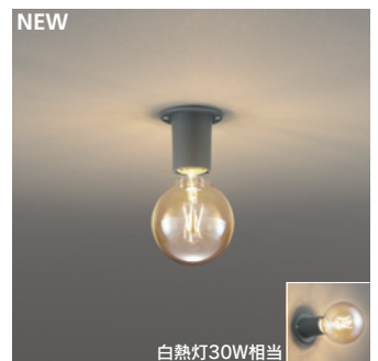
NEW OL 251 716LC1 [電球色] ¥8,800 (税抜き) [調光器別売]

適合調光器 → P.852-855-859 → P.856-861 別売 LC 211-212-213 LC 221-222-602-603-702 別売 LC 611-613 LC 615