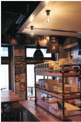
OL 013 069LC [実例番号 E11802_01S]