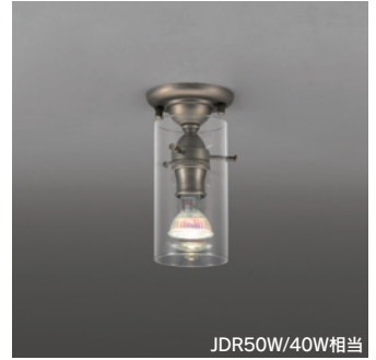
OL 251 718 ¥13,800 (税抜き) [ランプ・調光器別売]

適合調光器 → P.852-855-859 → P.856-861 別売 LC 211-212-213 LC 221-222-602-603-702 別売 LC 611-613 LC 615