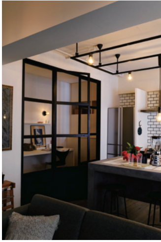
OL 291 164LC/OL 291 163LC [実例番号 F10601_003K]