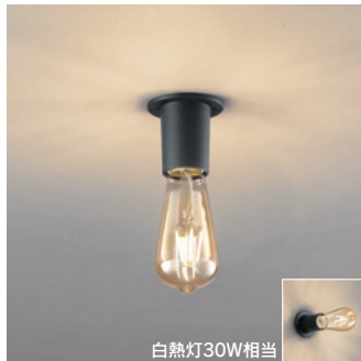
OL 013 069LC [電球色] ¥7,800 (税抜き) [調光器別売]