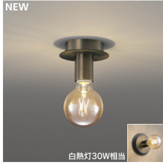
NEW OL 291 163LC [電球色] ¥12,800 (税抜き) [調光器別売]