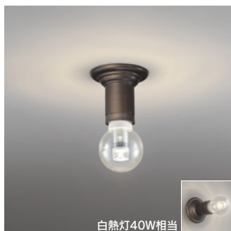
OB 255 139LC [電球色] ¥9,800 (税抜き) [調光器別売]