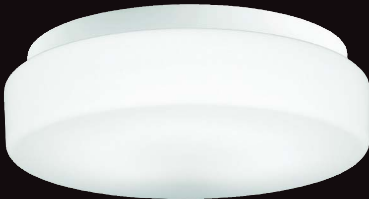
FCL30Wクラスと同等の明るさ